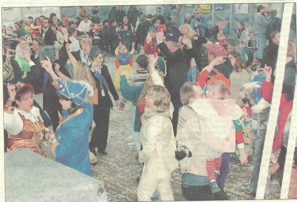
De l'ambiance à revendre, le samedi après-midi, lors du bal costumé des enfants. Et il n'y a pas que les petits qui s'amuse...