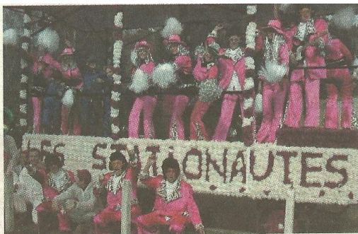
Quand les pompistes font la fête