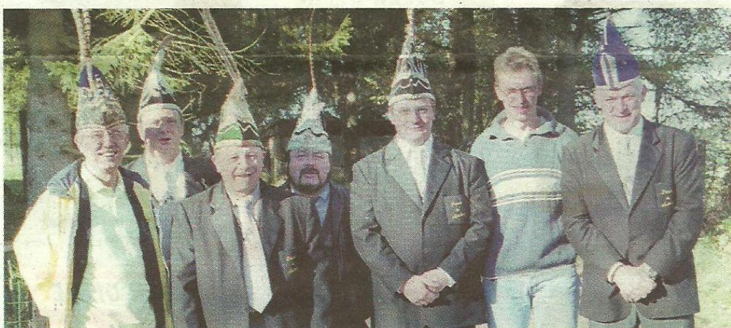
Les 7 princes carnaval de Martelange ont constitué une asbl