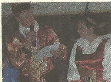
le discours d'intronisation de Serge II