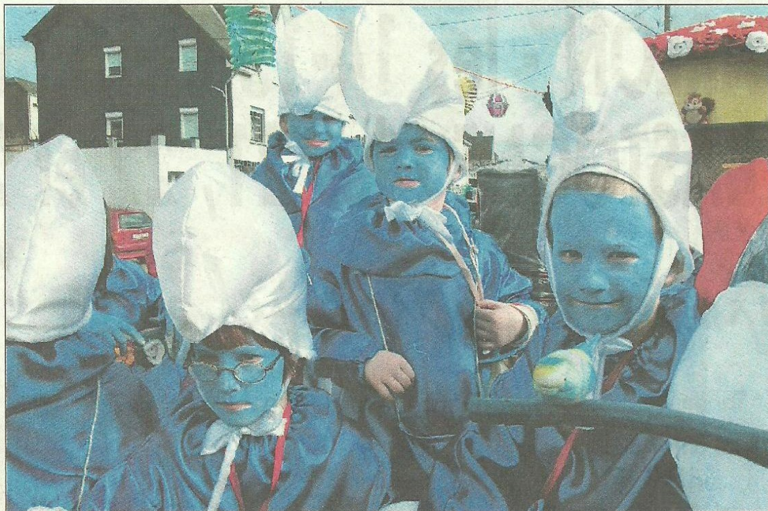
Martelange, le pays des Schtroumpfs ou un village où les habitants voient la vie en bleu ? AL 134135