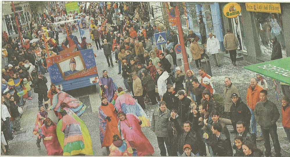
Tausende von Zuschauern wollten das farbenfrohe Spektakel trotz teilweise miesen Wetters nicht verpassen.