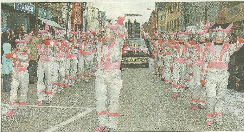
Die Kostüme dieser grauen Eminenzen passten zum Wetter, das gestern zeitweilig vorherrschte.