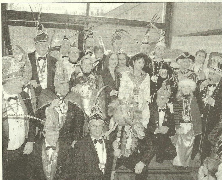
L'amicale des princes carnaval a remis plusieurs dizaines de médailles à ceux et celles qui se coupent en quatre pour la bonne organisation des festivités à la cité ardoisière