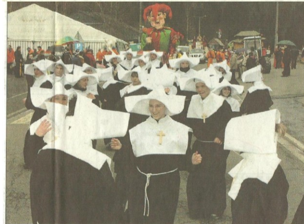
Bien que le carême ait débuté mercredi, les religieuses de Vaux-les-Rosières ont profité de cette journée dominicale pour faire la fête ! AL 810307, AL 810300, AL 810301