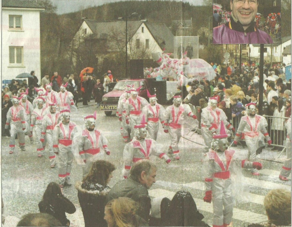
Cette année, les Martelangeois avaient fait de réels efforts, les costumes et chars de certains groupes étaient de toute beauté comme ici cette symphonie rose des Stationnaires. AL 810308

LUNDI 26 FÉVRIER 2007 L'AVENIR DU LUXEMBOURG